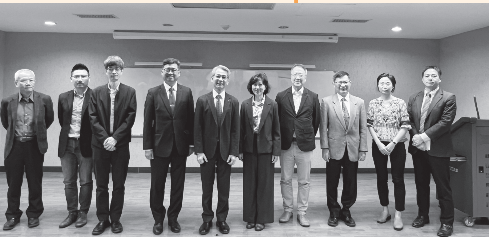
CTPECC亞太區域論壇「人力資源發展與職業衛生安全」